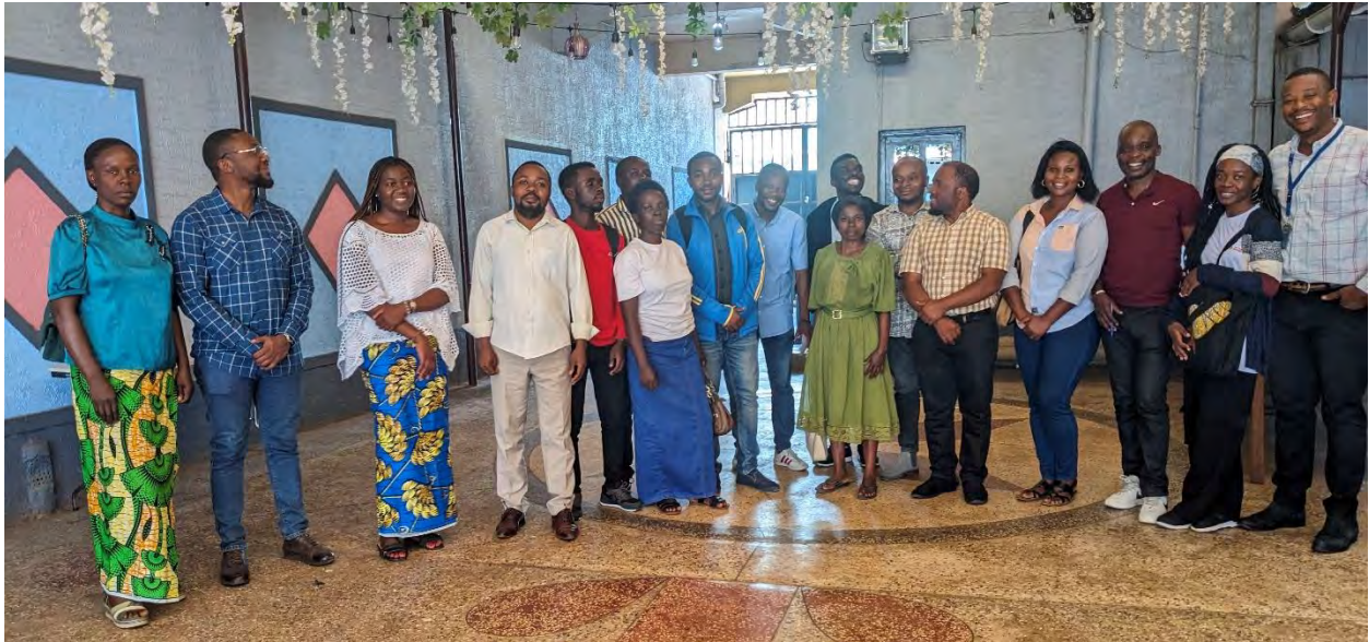
Photo de famille après formation

Après la sélection des partenaires locaux, Heal Africa a organisé une formation de reformation de capacité où les organisations locales sélectionnées ont été formé en gestion de projet notamment en gestion de ressource humaine, gestion financière, comptabilité et suivi et évaluation des projets humanitaires.