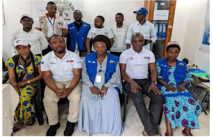
Quelques photos prises lors de l'évaluation institutionnelle dans le bureau de HOL-DRC

Après la sélection des partenaires locaux, Heal Africa a organisé une formation de reformation de capacité où les organisations locales sélectionnées ont été formé en gestion de projet notamment en gestion de ressource humaine, gestion financière, comptabilité et suivi et évaluation des projets humanitaires.