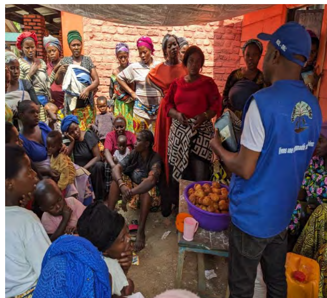
Activité de Soutien psychosocial et psychologique et sensibilisation contre le VBG