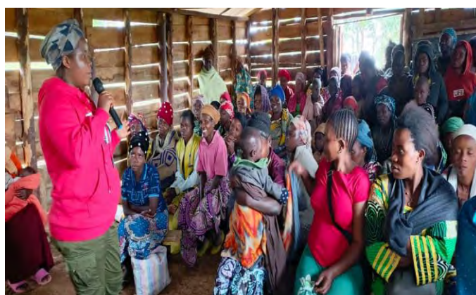
Séances de sensibilisation